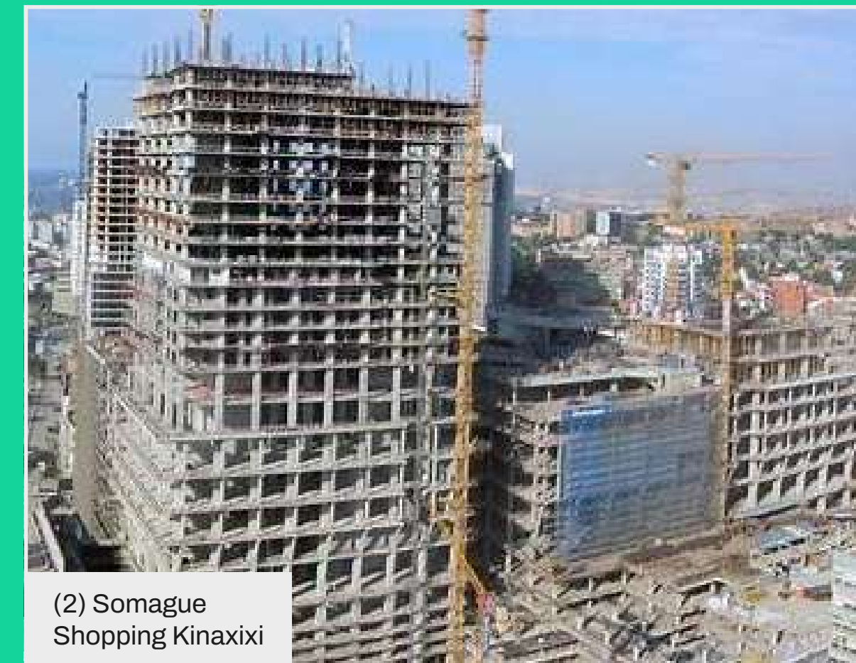
(2) Somague Shopping Kinaxixi