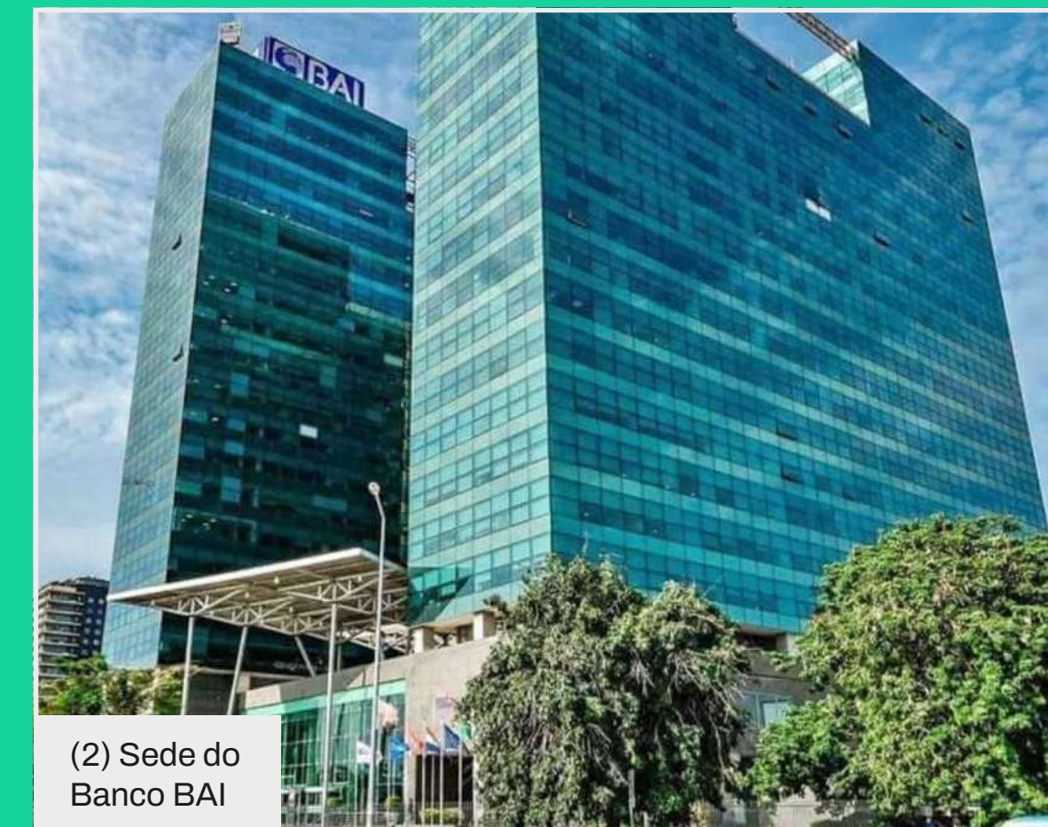
(2) Sede do Banco BAI