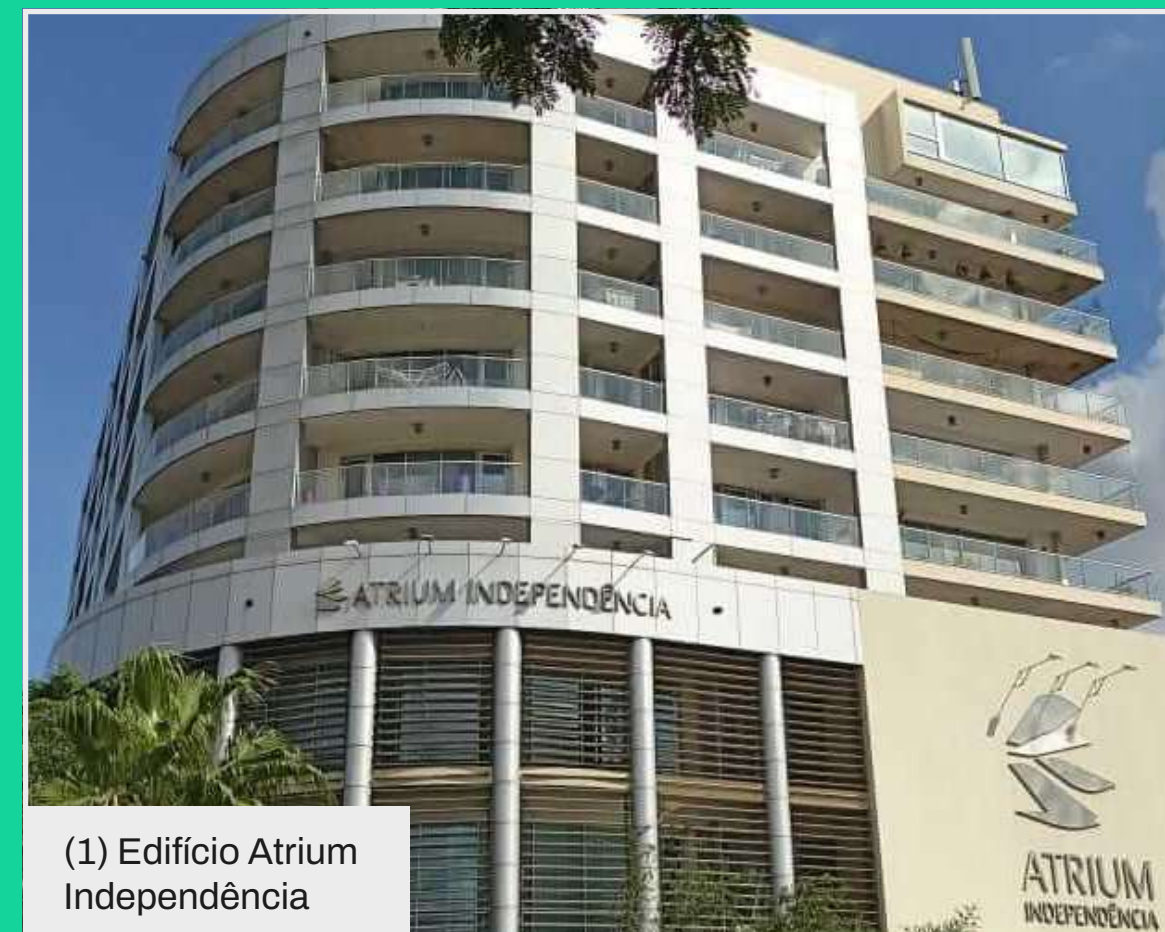
(1) Edifício Atrium Independência