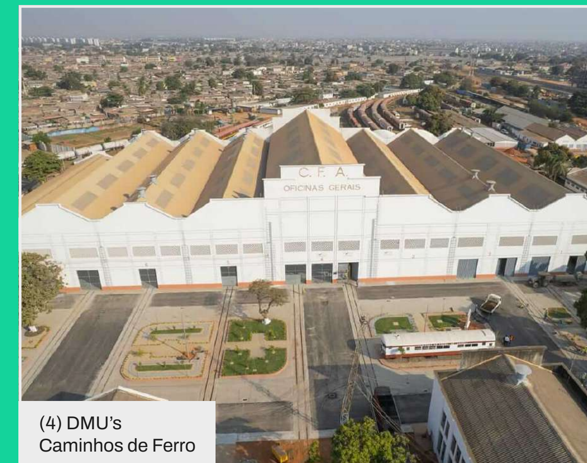
(4) DMU's Caminhos de Ferro