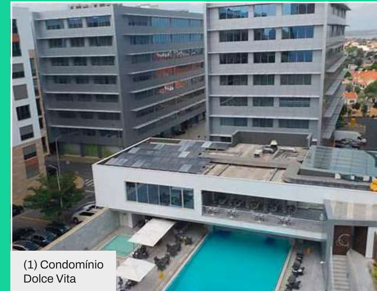
(1) Condomínio Dolce Vita