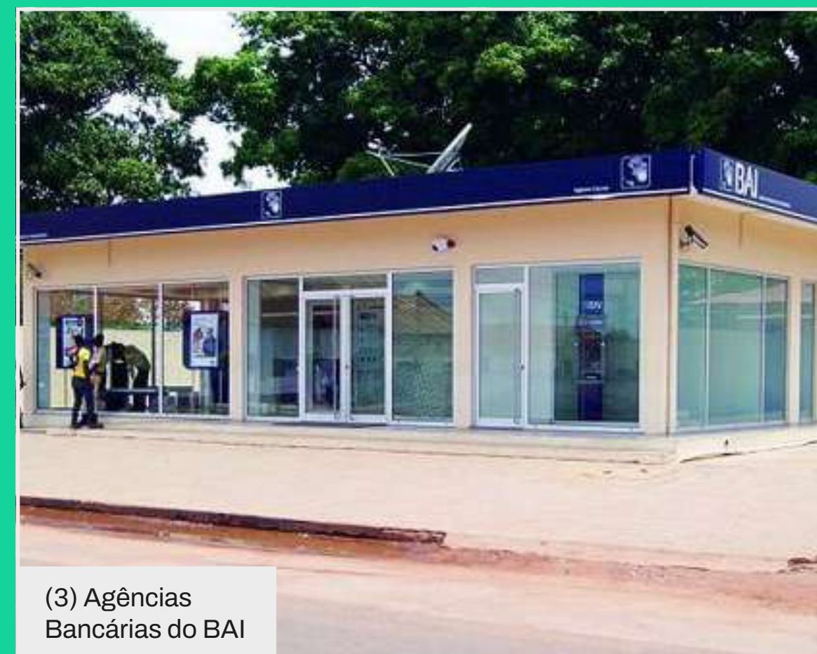
(3) Agências Bancárias do BAI